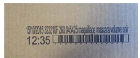
Exemples de réalisations de marquages sur carton avec le M7