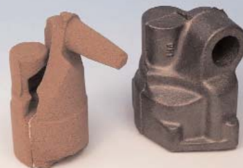
Forme intérieure de noyau de sable Pièce finie de pompe