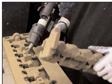
Noyau de sable et pièce finie de culasse