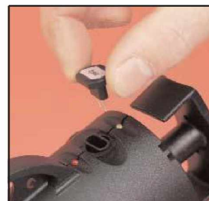
Modules de température