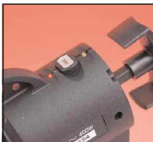
Lampes témoin de mise sous tension