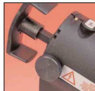
Molette extérieure pour un réglage facile de la course du piston